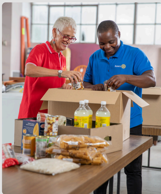
Rotary Clubs de Melbourne e arredores recebem doações de móveis e de outros itens domésticos. Contando com a participação de 15 clubes rotários da região, o projeto oferece mobílias, utensílios e eletrodomésticos para pessoas que passaram por crises originadas pela falta de habitação, violência doméstica, prisão, deslocamentos e outros motivos. Austrália, 19 de março de 2023.

Talvez a melhor resposta à pergunta do título deste artigo esteja na experiência de cada clube. O valor mais importante, em cada momento, é aquele que precisa de ser praticado com mais coragem. A maturidade rotária está em perceber no tempo certo.